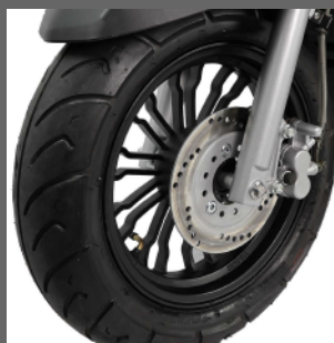
Disk Brakes Freni a Disco