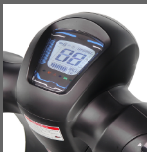
LCD Meter Strumentazione LCD